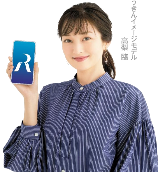
ろうきんイメージモデル 高梨臨